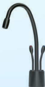
דגם: 37KB307 צבע: שחור מט