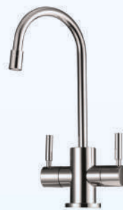
דגם: 37KB316 צבע: ניקל מוברש