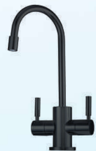
דגם: 37KB317 צבע: שחור מט