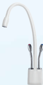
דגם: 37KB310 צבע: לבן