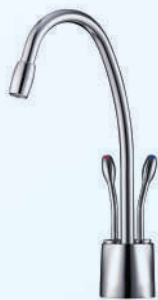
דגם: 37KB306 צבע: ניקל מוברש