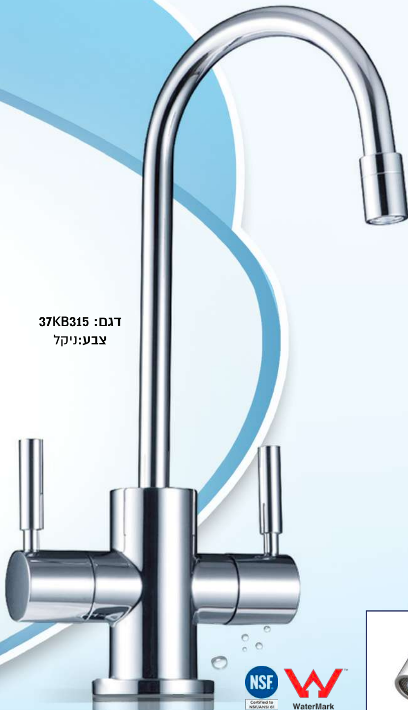
דגם: 37KB315 צבע: ניקל