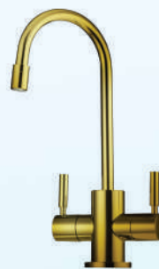
דגם: 37KB319 צבע: זהב מוברש