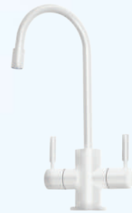
דגם: 37KB320 צבע: לבן