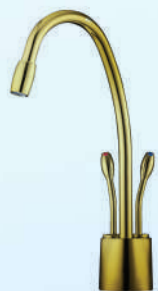
דגם: 37KB309 צבע: זהב מוברש